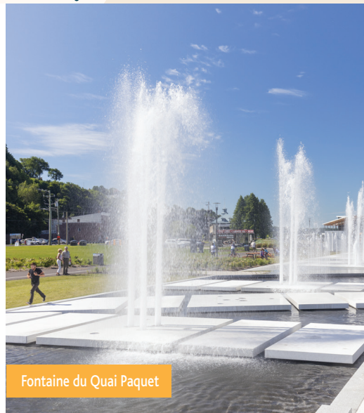
Fontaine du Quai Paquet