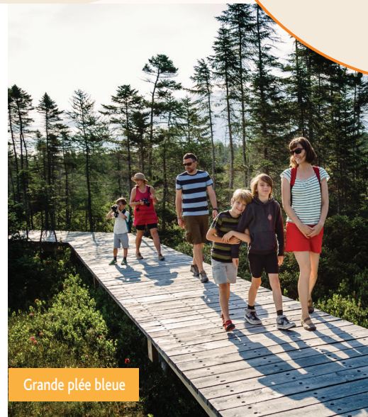
Grande plée bleue