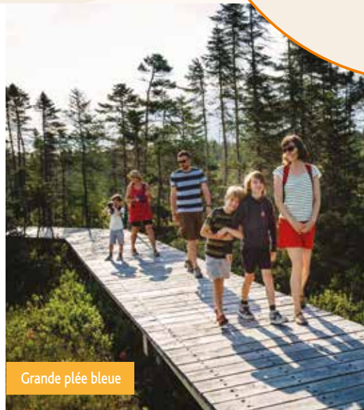
Grande plée bleue