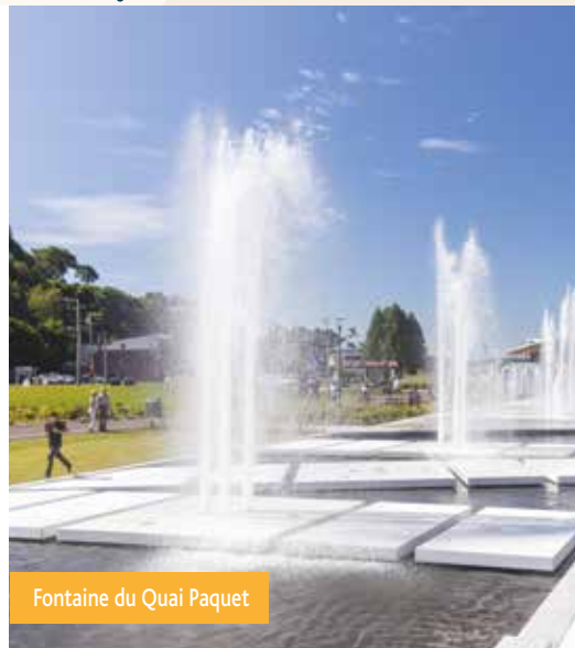
Fontaine du Quai Paquet